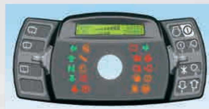
Boven: het geavanceerde en geïntegreerde dashboard-display is voorzien van een niet reflecterend, backlit LCD-scherm en de 21 indicatielampjes geven overzichtelijke en snelle informatie in alle omstandigheden.