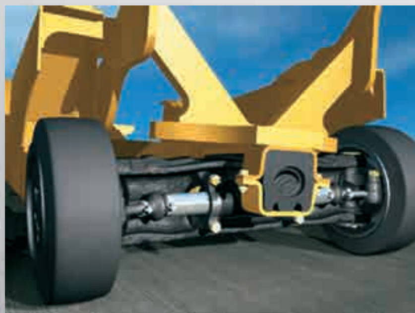
Above: HSM™ (Hyster Stability Mechanism) reduces truck lean in turns, improving lateral stability. The design allows for superior travel over uneven surfaces.

De optionele RTST (Return to Set Tilt) heeft programmeerbare instelpunten voor de uitlijning van mast en vorken en is uiterst handig voor toepassingen waar het niet parallel stapelen producten kan beschadigen.