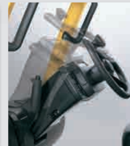
Links: het standaard stuur met een diameter van 30 cm en een stuurknop is uitgerust met een volledig verstelbare stuurkolom. Onder: de achter de stoel geplaatste handgreep zorgt voor een uitstekende grip tijdens het achteruitrijden en biedt tevens gemakkelijk toegang tot de extra claxonknop.